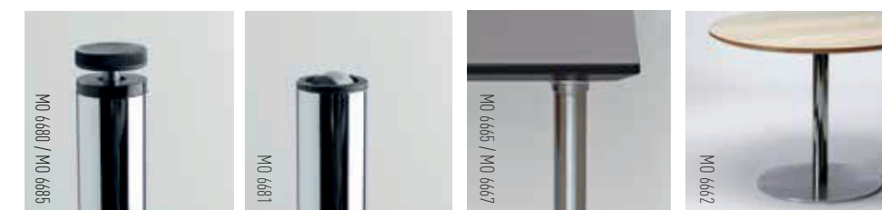
BRUNCH TABLE MO 6680 PAUSE ARMCHAIR MO 8653