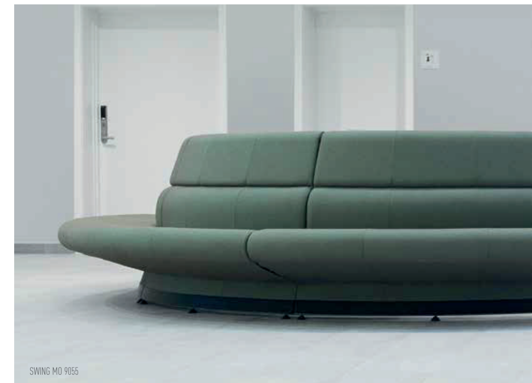
SWING MO 9055