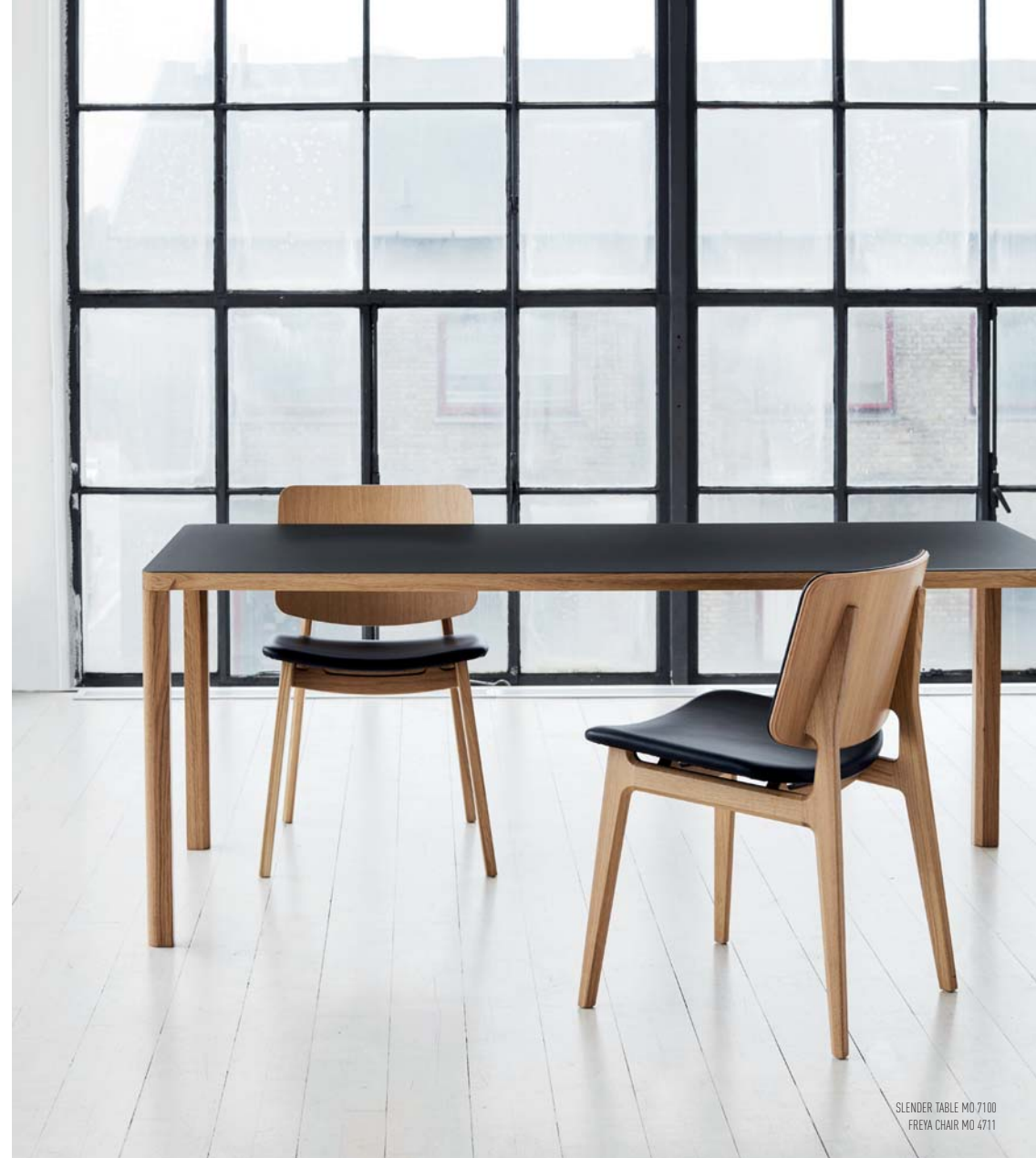
SLENDER TABLE MO 7100 FREYA CHAIR MO 4711